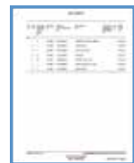
데이터 모듈 및 작업 문서 PDF 동시 확인 가능