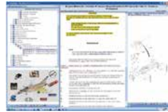
PDF/IETM Data set 검증, BREX 확인, 보기 및 생성을 위한 All-in-One 솔루션